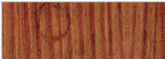
Mit Pflegebalsam: intakte Oberfläche