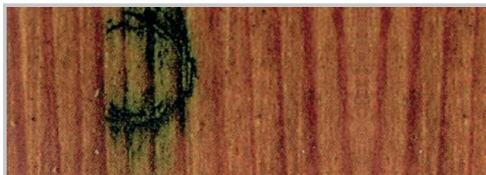
Ohne Pflegebalsam: Bläuebildung